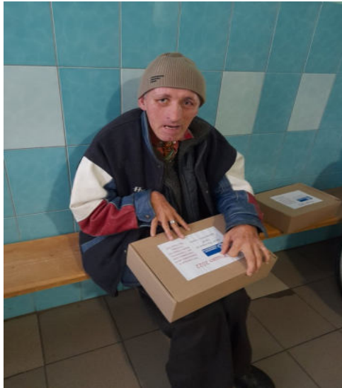
Nous avons visité de nombreuses personnes à domicile, des handicapés et des retraités