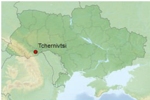
Tchernivtsi sur la carte de l'Ukraine.