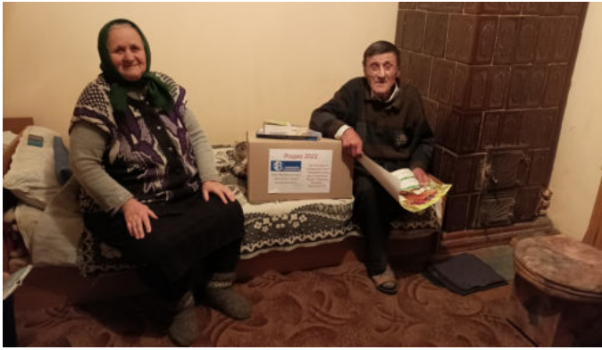
...dans un foyer de personnes âgées du service social.